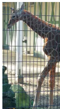
Beestenboel in Artis.

Op vrijdag 20 april aan einde van de middag werd het VO-ING Artis netwerkevent gehouden met een avondprogramma. In een ongedwongen sfeer en onder het genot van een hapje en een drankje in de zon werd er genetwerkt in het mooie Noordpaviljoen van Artis, de oudste dierentuin van Nederland.