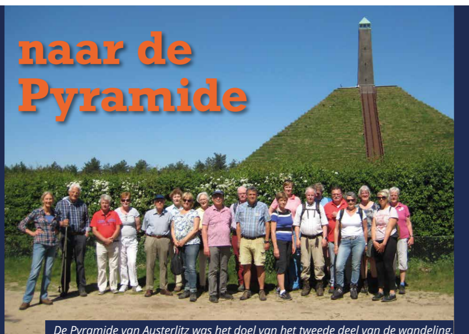
De Pyramide van Austerlitz was het doel van het tweede deel van de wandeling.