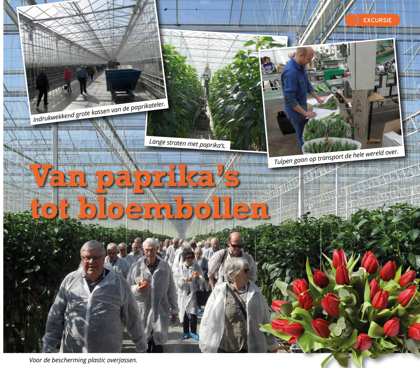
Indrukwekkend grote kassen van de paprikateeler.