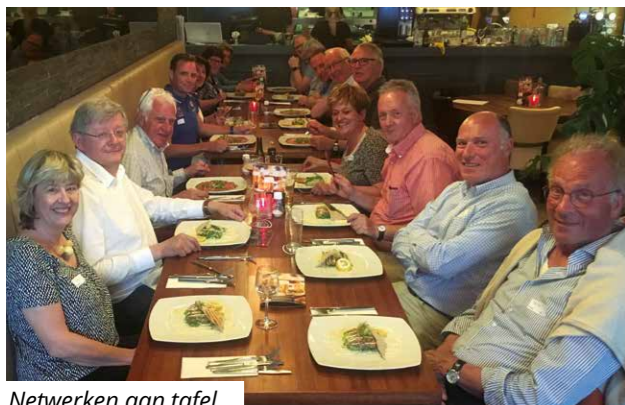
Netwerken aan tafel.