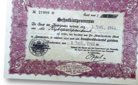
Vervalste schatkistpromesse t.n.v. Rijkspostspaarbank, 1944.

Omdat contant geld schaars was nam Van Hall contact op met de directeur